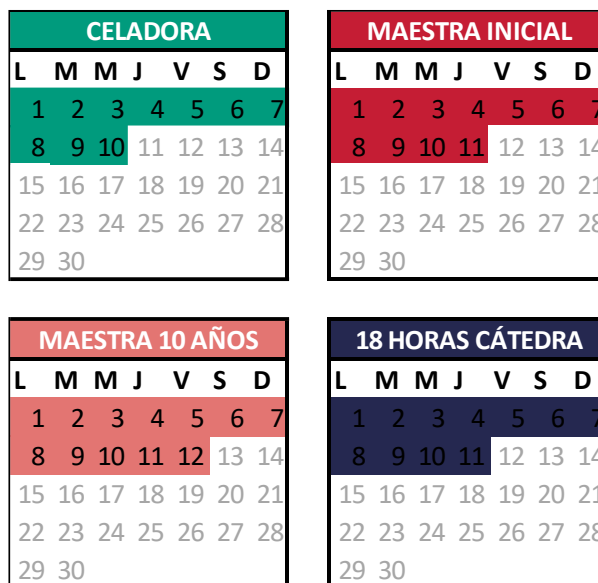
Gráfico 3: Cantidad de días cubiertos por los salarios